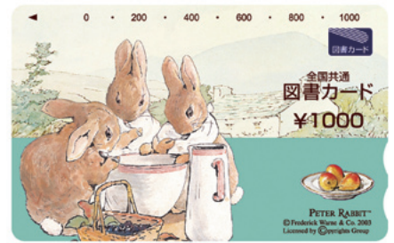
sample BEATRIX POTTER™ and PETER RABBIT™ © F.W. & Co.