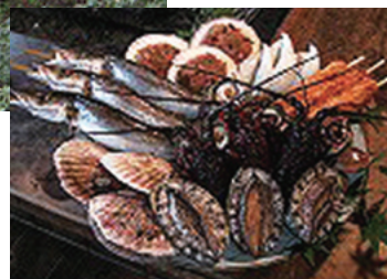
海鮮炉端焼き (昼食イメージ)