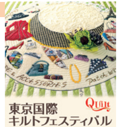
東京国際キルトフェスティバル