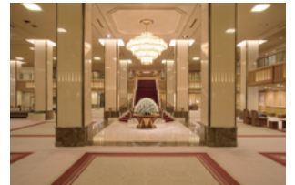
帝国ホテルロビー