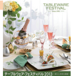
テーブルウェアフェスティバル 2013